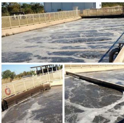
Figura 06: Reatores de lodos ativados da ETE Norte

Subsequente aos reatores UASB, o esgoto é conduzido para os Reatores de Lodos Ativados (figura 06), Miguel (2004) apud Oliveira (2006) afirma que nesse momento incorpora-se matéria orgânica a um tanque, e sob determinadas condições, bactérias aeróbias são suspensas, de modo a degradar a matéria orgânica restante da etapa anterior (reatores UASB), nessa etapa também ocorre a remoção dos nutrientes.