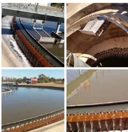
Figura 07: Decantadores da ETE Norte

Posterior aos reatores de lodos ativados, o esgoto é conduzido para os decantadores, nessa etapa separa-se a parte líquida do lodo remanescente, ocorre a separação dos sólidos em suspensão, possibilitando a saída de um efluente clarificado, além disso, nessa dá-se também a sedimentação do lodo no fundo do decantado (OLIVEIRA, 2006).