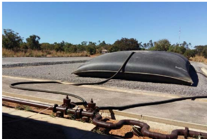
Figura 08: Bag de geotêxtil da ETE Norte

Uma ponte rolante possibilita acúmulo do lodo sedimentado em um poço de sucção, no qual, através de um conjunto elevatório é bombeado e assim retorna para ao tanque de aeração, sendo o efluente tratado coletado na parte superior do decantador e lançado no reservatório da Usina Hidrelétrica Luís Eduardo Magalhães. O lodo produzido no sistema da ETE Norte é destinado ao tanque de lodo e em seguida encaminhado a bags de geotêxtil (figura 08).