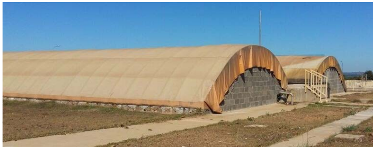
Figura 05: Reatores UASB da ETE Norte

Seguido do tratamento preliminar, o esgoto é encaminhado para os Reatores Anaeróbios de Fluxo Ascendentes, conhecidos também como reatores UASB (figura 05), nos quais, Jordão e Pessôa (2005) afirmam que nessa etapa, ocorre o processo de decomposição da matéria orgânica e se dar a produção de lodo e gás, este, por sua vez é incinerado, enquanto aquele é direcionado para a lagoa de lodo.