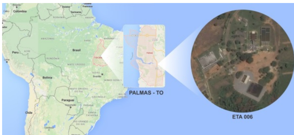
Figura 01: Localização da ETA 006.

central e da região sul, as outras são sistemas menores que servem apenas para complemento. A ETA 006 está localizada nas coordenadas geográficas: 10°17'16,66" S e 48°17'41,69" O, conforme a Figura 01.